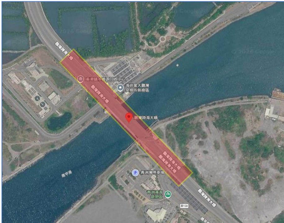
圖 1 鵬灣跨海大橋施工位置示意圖