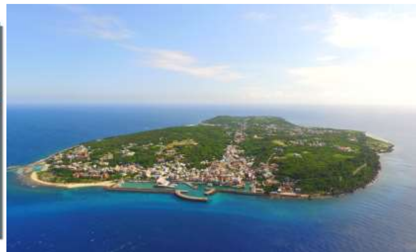
臺灣唯一的珊瑚礁島嶼