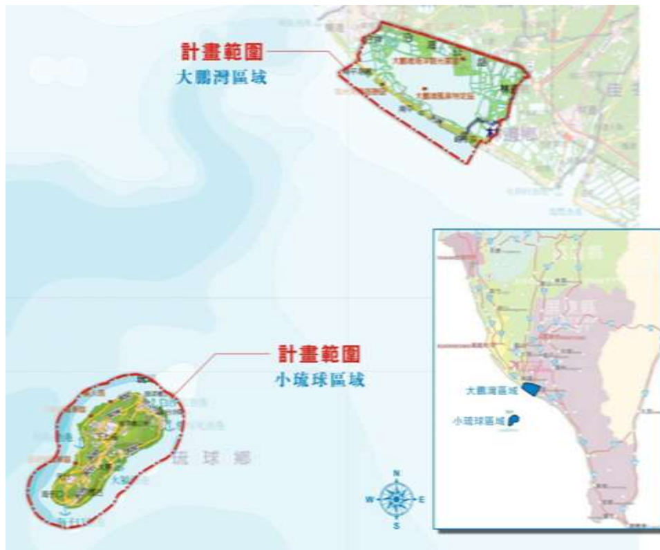
臺灣唯一囊狀潟湖