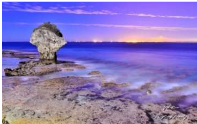
屏東縣-(4)小琉球花瓶石 海岸珊瑚礁被地殼隆起作用產生