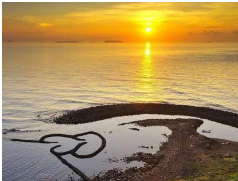
澎湖-(5)七美雙心石滬