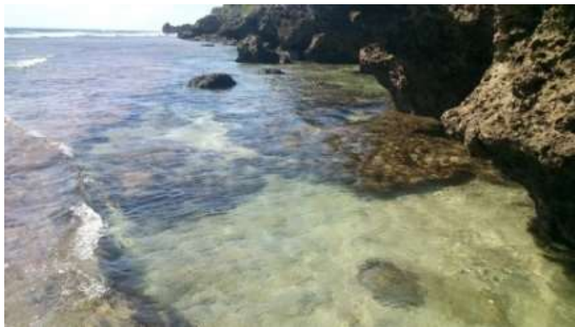
屏東縣-(4)小琉球杉福生態廊道 實施潮間帶遊客總量管制措施