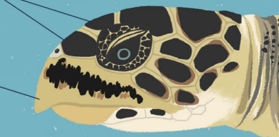
玳瑁 Hawksbill turtle